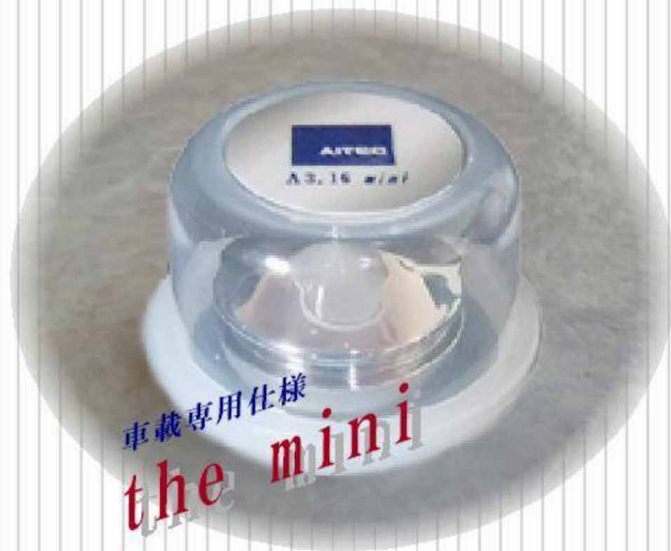
A3.16mini 販売価格 オープン 寸法 直径 65mm 高さ 38mm 重量 約260g

30年間の開発研究の末に完成した究極のモデル・新たに車載モデル発売 業界初 !! 《なんと視聴覚環境補正が可能》 夢のアイテムが登場。